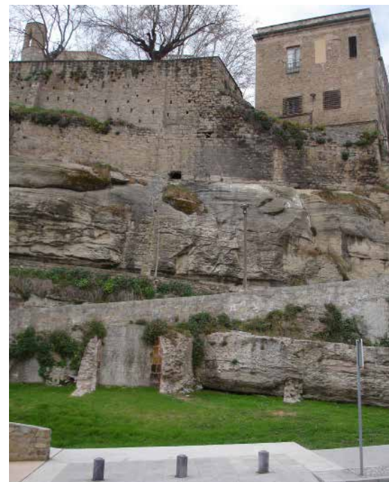
Restes d'una tina al carrer de Sant Marc, sota el carrer de la Codinella, a la cinglera del turó del Puigcardener, amb la Seu al capdamunt.

La majoria d'aquestes tines, o de les restes que en queden, van començar a ser construïdes de forma massiva en el segle XVII amb pedra i morter per a substituir les de fusta. La seva forma sol ser cilíndrica o cúbica, de base circular o quadrangular, d'unes dimensions que els donen una capacitat d'embotada de milers de litres. La paret interior del dipòsit, on fermentava el most, és folrada amb cairons, o rajols, de 40 x 40 cm, de ceràmica vitrificada per a garantir la seva impermeabilització i facilitar la seva neteja. A la part superior, una lleixa feia de suport per al brescat, els taulons o posts de fusta travessers de banda a banda on aixafen la verema. A la base, un forat o broc, la boixa, servia per a trascolar el vi a les portadores, les bótes o qualsevol altre recipient.