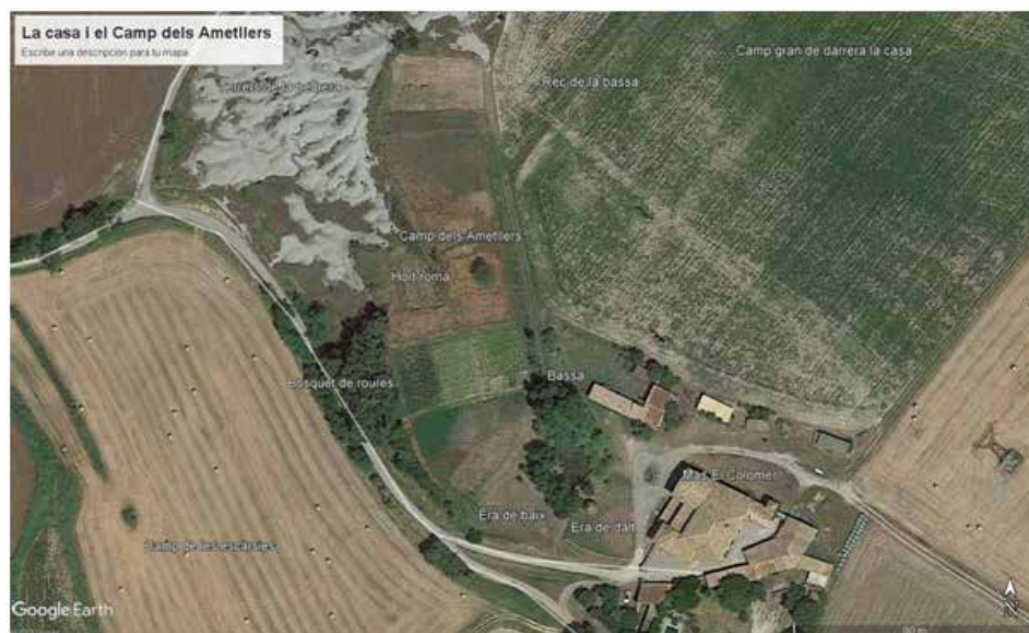
Imatge 2: Mas el Colomer i Camp dels Ametllers

L'any 2010 es va destinar al projecte un camp de dues quarteres, uns 6.000 metres quadrats, adjacent al Mas el Colomer de Taradell (Imatge 2), una casa pairal amb orígens els segles XI i XII (Pladevall, 1995; Ponce i Torrents, 2015). El camp es va compartimentar en cinc feixes per restituir la rotació quadriennal de conreus, coneguda per la pagesia de la Plana de Vic com a trènit. S'empren les tècniques agrícoles d'abans de la mecanització, sense l'ús d'adobs químics ni herbicides, es recuperen llavors autòctones i es té cura dels marges i de l'entorn ecològic.