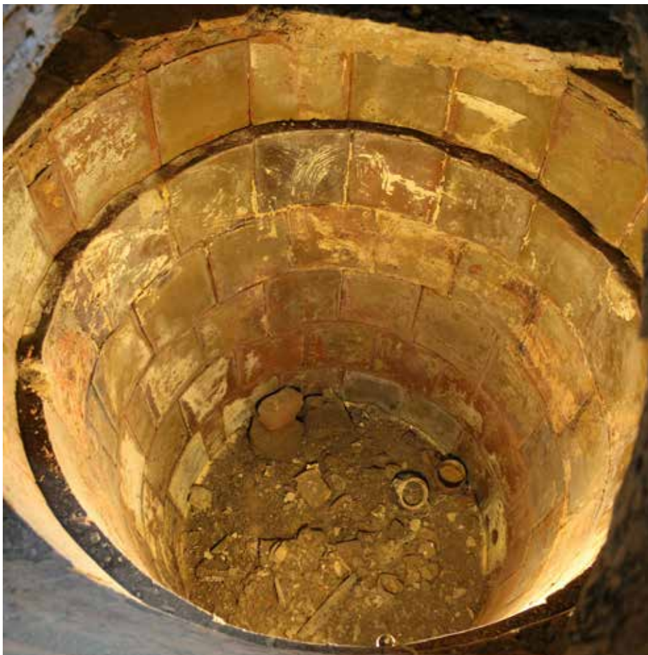
Interior d'una tina de cairons en una casa entre el carrer de Santa Llúcia i la Via de Sant Ignasi. A la dreta, restes de dues tines en un solar del carrer de Sant Bartomeu, al barri de les Escodines.

La tina de pedra i cairons, tan característica del Bages, datada entre els segles XVI i XIX, tenia la funció de realitzar el procés de vinificació en un sol cos. La seva estructura sintetitza l'esquema de les tines medievals excavades a la roca, en què el raïm era trepitjat en un recipient de poca fondària, el follador, també anomenat piadora o funyador, connectat per una petita conducció a un altre de més fondària, que feia de dipòsit de fermentació.