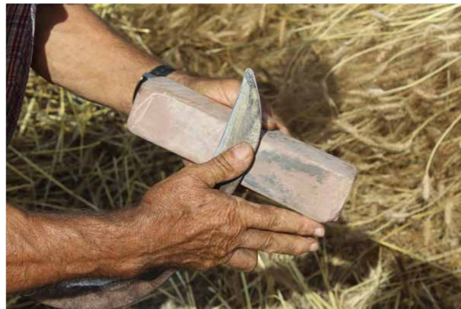
Imatge 1: Detall de la gestualitat de la feina d'esmolat el volant amb la pedra d'esmolat

L'origen de la XPREB rau en la recerca etnològica de l'ofici de pagès de Jacint Torrents (2009, 2013), qui va inventariar i documentar tres col·leccions que havia aplegat al mas el Colomer de Taradell Joan Lleopart (etnògraf amateur i alma mater de la XPREB): guarniments d'animals de peu rodó (2000), cistells (2001) i eines agrícoles (2003). Cada eina (tangible) servia per fer una feina, la qual s'executava amb una gestualitat tècnica determinada (intangibles, Imatge 1), en vies de desaparició. Torrents també va estudiar el sistema de rotació quadriennal de conreus, anomenat trènit, practicat a la Plana de Vic abans de la mecanització. El projecte del Camp experimental dels Ametllers va néixer amb l'objectiu d'usar les eines del pagès fent les feines corresponents, en el context en què van desaparèixer aquestes feines (el trènit).