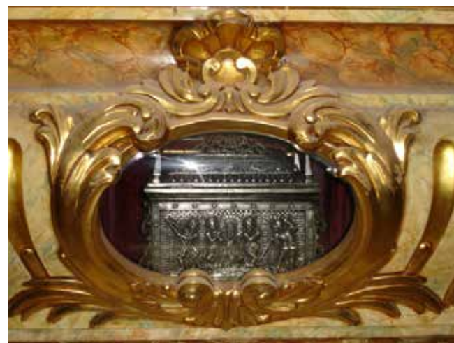
Arqueta dels Sants Màrtirs, Llucià i Marcia, de Vic

I és que escriure quatre romanços d'un mateix context temporal, en aquest cas en referència exclusiva a la sequera de 1817, representa una decisió plenament mesurada i conscient. Els fets, a ulls dels osonencs de principis del segle XIX, devien ser ben mereixedors de fixar-los i transmetre a les generacions futures. Sembla que el sentiment del feligrès o observadors agraïts, davant les penes i treballs per sobreviure, havien de destacar notablement. I ho havien de fer, més enllà de la constància documental burocràtica de les autoritats civil i eclesiàstica que, al costat d'aquestes quatre obres de la literatura popular, permeten validar i situar degudament en el camp de la historiografia.