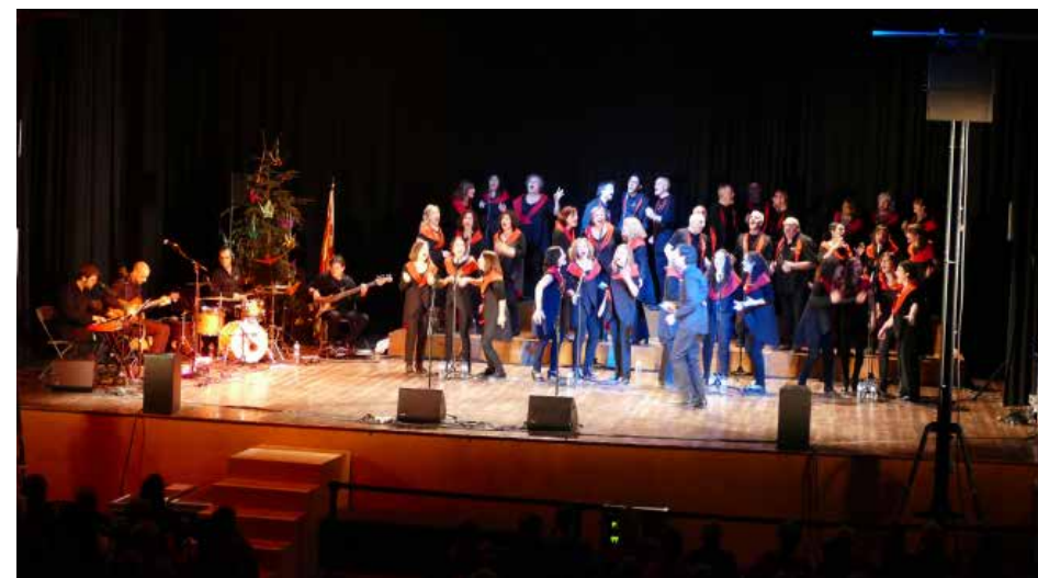
Actuació de Tastet de Gospel l'1 de gener de 2018 a l'escenari del Centre Cultural Costa i Font de Taradell.

Amb aquest recull de l'activitat de cant coral a Taradell volem posar en valor les experiències viscudes amb les seves obres i, qui sap, si tornar-les a la vida de la interpretació, fent, alhora, una crida a la recuperació del patrimoni musical.