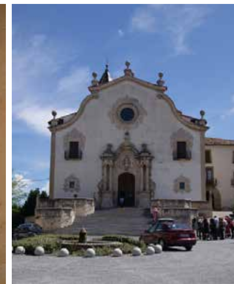
Arqueta de sant Fortià, venerat a Torelló; Mare de Déu del Bonsuccés; Santuari de la Mare de Déu de la Gleva a Les Masies de Voltregà.