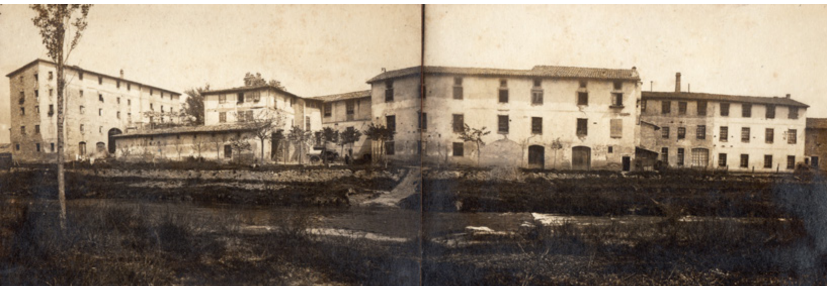
Vista general exterior de la fàbrica i colònia de Malars a finals del segle XIX. A la plaça de la colònia es veu una tartana amb el cavall. Procedència: AMG, Arxiu d'Imatges, Imatges de Malars, Fons família Oliva-Rifà.

Com ja hem vist, la primera fàbrica de Malars seria destruïda l'any 1837 de la mà dels carlins, però a la dècada dels 40 seria objecte d'una important reforma que la convertiria en una de les fàbriques de tissatge i filatura punteres de la comarca, sobretot pel que fa a la mecanització del procés gràcies a l'energia hidràulica. 52