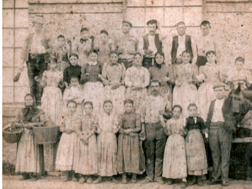
Grup de treballadors de la fàbrica de Malars, l'any 1889.

Aquestes associacions són de tipus proteccionista i corporativista i es dediquen al socors mutu dels associats, més que no pas agrupacions de