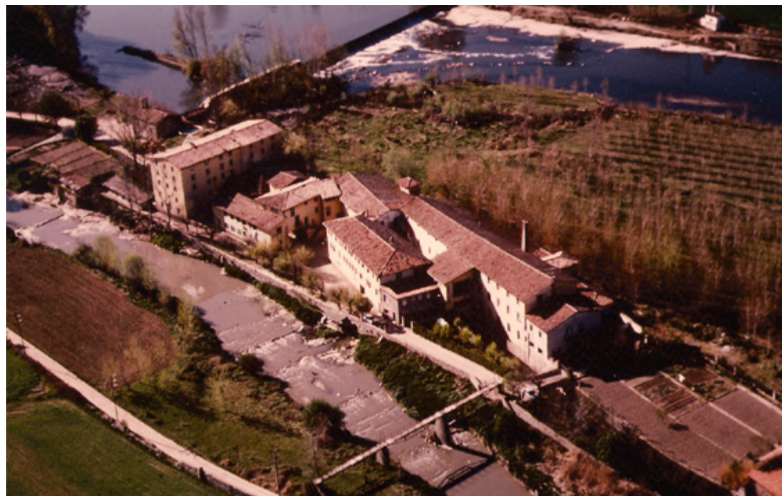
Vista aèria de finals del segle XX de la fàbrica vella de Malars situada en una devesa entre el riu Gurri, en primer terme, i el Ter, al fons. Als anys seixanta es va construir una nova fàbrica, allunyada del riu per evitar els estralls derivats de les contínues revingudes.

mogudes per l'aigua del riu, 6 Pascual Madoz, en el seu viatge per terres d'Osona (entre 1845 i 1850), ens dona una visió d'aquest establiment fabril diametralment oposada. El descriu com un conjunt integrat per dos edificis espaiosos amb algunes cases al seu entorn, amb dos jocs de batans, sis màquines de cardar cotó i d'altres de complementàries, vint màquines de filar cotó amb 240 pues cadascuna, modernes, amb els corresponents rellotges reguladors que modificaven el moviment de les màquines i aconseguen productes de gran qualitat, capaços de plantar