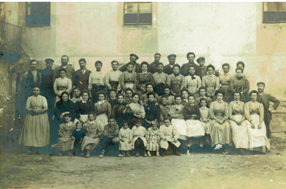
Grup de treballadors de Malars de finals del segle XIX. Crida l'atenció l'important nombre de dones i de criatures que hi havia a la fàbrica en aquell moment.

quedar esmorçant amb ella al costat de la màquina. També en aquest cas, a la testimoni, li assignen el cognom del marit, Meliton Baucells, germà d'un dels ferits en els fets del dia 14 de juliol. 100