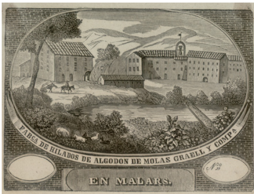
Anagrama de la societat Molas, Graells y Cia. AHCB13387

En aquest període, doncs, Malars viu una etapa d'espectacular creixement, tant pel que fa al nombre de treballadors que, d'acord amb les fonts, podríem xifrar en un significatiu augment del 365% en pocs anys, com pel que fa a la maquinària. D'altra banda també s'evidencia que la producció, ja en aquest moment, era tant de filatura com de tissatge. Una doble aposta que mantindrien els propietaris fins ben entrat el segle XX.