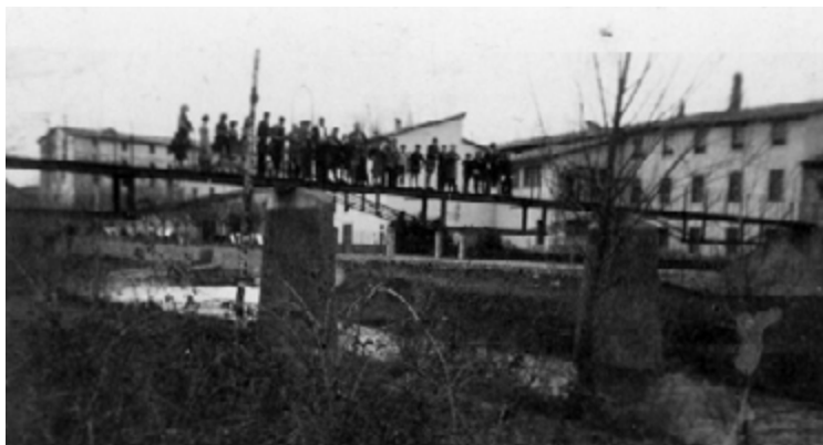
Dues instantànies de la dècada de 1920 i 1930, respectivament, en les quals apareix la palanca que travessa el riu Gurri i permet accedir a la fàbrica des del cantó de Roda sense haver de travessar aquest riu. Aquesta passera de ferro va ser un dels escenaris principals dels enfrontaments del 1853.